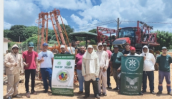
Agrotóxicos Aplicação com Pulverizador de Barras Tratorizado