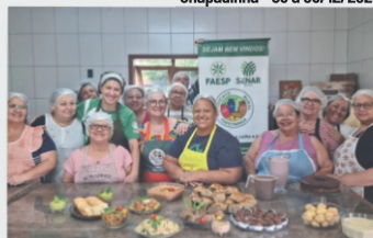
Processamento Caseiro de Banana Verde - Biomassa