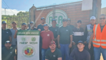
Operação de Tratores Agrícolas