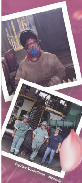
Equipe Soldadoras - Moenda