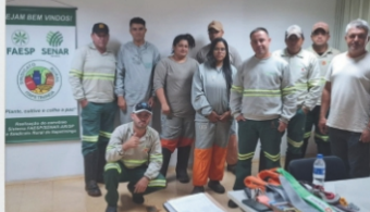
Segurança no Transporte, Movimentação, Armazenagem e Manuseio de Materiais NR 11