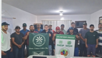
Segurança no uso correto de Agrotóxicos - NR 31.7