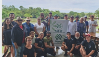
Torneio de Pesca