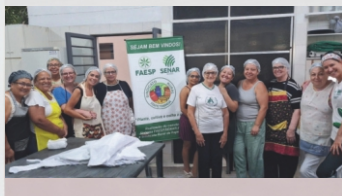
Processamento Caseiro de Carnes de Peixes