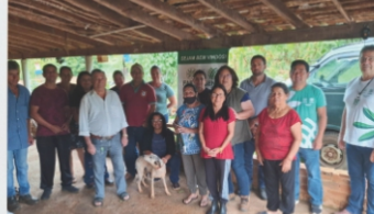
Morango Orgânico - Sensibilização