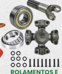
ROLAMENTOS E CRUZETAS