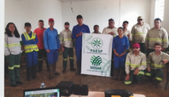
Proteção e Combate a Incêndio - NR 23