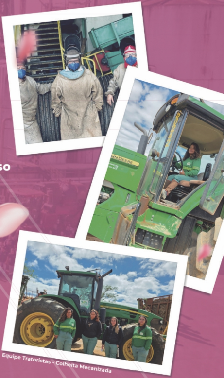
Equipe Tratoristas - Colheita Mecanizada

Uma solução prática para sair do vermelho