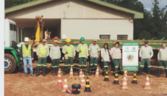
Operação de Caminhão Guindauto (Munck)