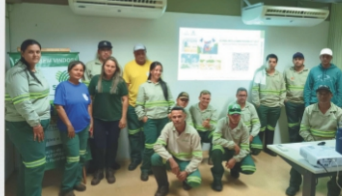
Segurança no uso correto de Agrotóxicos - NR 31.7