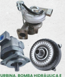
TURBINA, BOMBA HIDRÁULICA E CONVERSOR DO TORQUE

R. Luiz Gonzaga Rocha, 22 - Parque São Bento Itapetininga/SP | (Paralelo a Rod. Raposo Tavares, Km. 166,5 - próximo ao posto de guarda rodoviário)