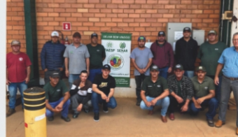
Manutenção de Tratores Agrícolas