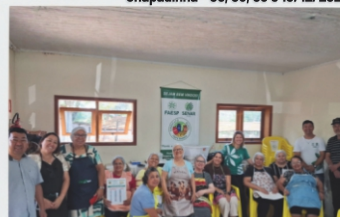
Processamento Caseiro de Leite