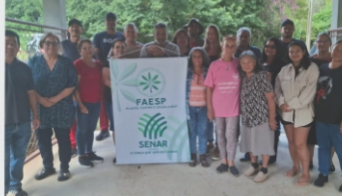
Morango Orgânico - Sensibilização