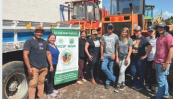
Operação de Pá Carregadeira